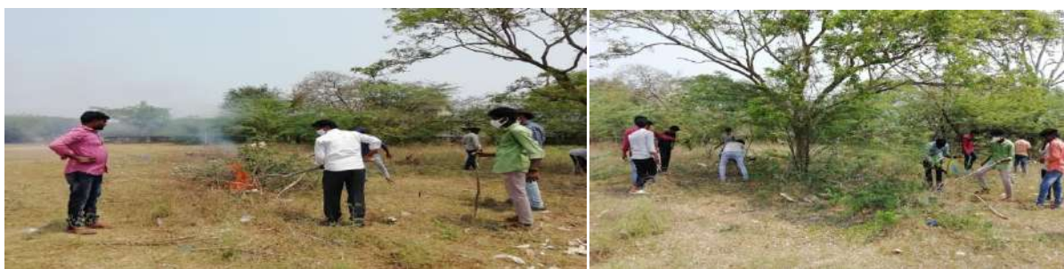
Volunteers Participated in Campus Cleaning Programme